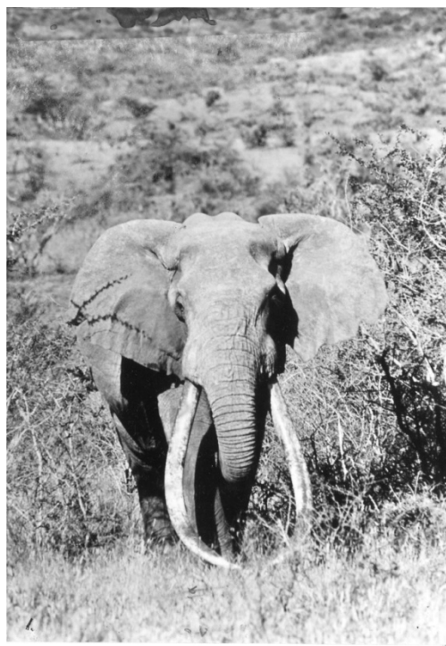
巨大なアフリカサバンナゾウ（1970年代。撮影：戸川幸夫）