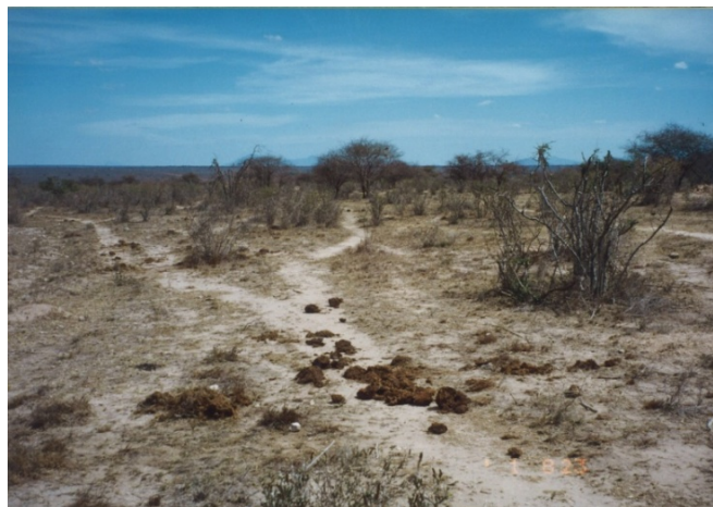
ケニアのツァボイースト国立公園に見られるゾウ道（2001年筆者撮影）

一方、ゾウの食性等は、自然植生、特にゾウが樹皮を剥ぎ押し倒す樹種に対し、破壊的にすら見える影響を与える。この現象は、特にアフリカのサバンナに長く広がる、疎林（ウッドランド）の変化しつつある様子に見ることができる。アジアでも、1970年代のスリランカで、ゾウが様々な樹木の樹幹を変形させ、樹皮を損傷し、押し倒した状況について記録されている。今日、このようなゾウが植生に及ぼす結果に基づいて、ゾウはいくつかの